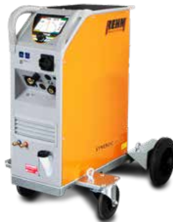
SYNERGIC.ARC 304-504 W