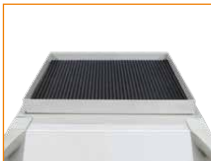
Toolbox für Kompaktgeräte SA (1381115)

Machen Sie, mit den möglichen Optionen und der nachrüstbaren Ausstattung, unsere Schweißgeräte zu Ihrer individuellen Maschine.