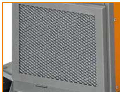
Nachrüstset Luftfiltervorsatz (1381353)