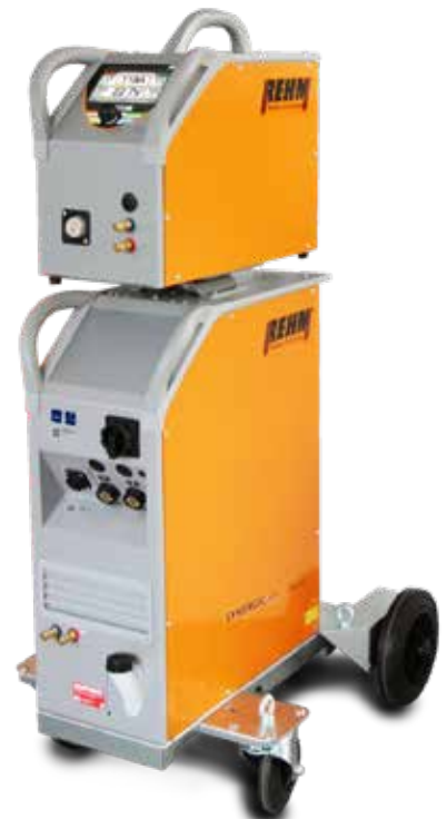
SYNERGIC.ARC 304-504 WS